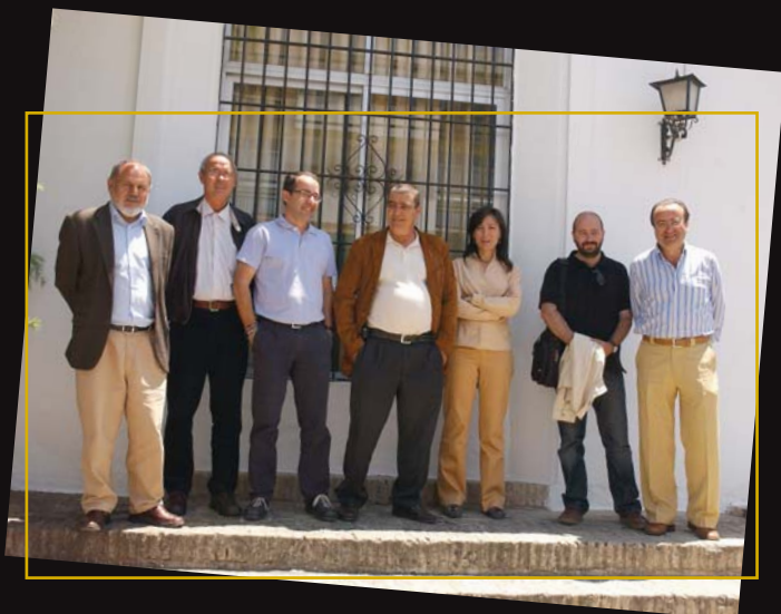
Miembros del jurado